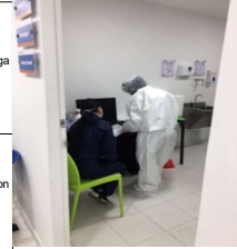
Realización Toma de Pruebas Covid-19 ARL - SURA