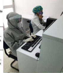
Central de Enfermería Sede Subachoque